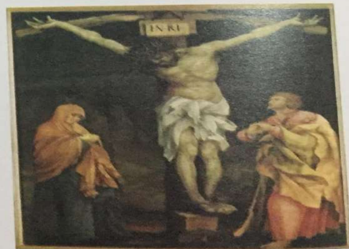
Matijas Grinevald • Raspeće • ulje na drvetu, 1523. god. Osoben njemački renesansni slikar specifične ekspresivne atmosfere