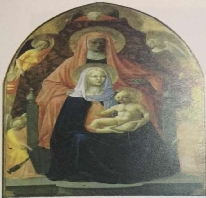
Tomazeo di Simone Mazačo • Madona sa djetetom i sv. Ana • tempera na drvetu, 1424. god

Leonardo da Vinči • Madona u pećini • ulje na platnu, 1495 - 1508. god. Jedan od najvećih majstora svjetskog slikarstva. U trećem planu Leonardo je primijenio sistem "sfumata", magličaste strukture čime je iluzija dubine prostora dovedena do savršenstva