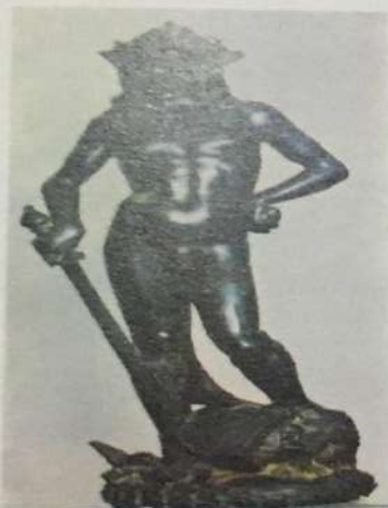
Donatelo • David • bronza, 1425. god.

djelovali na prostoru Italije, Njemačke, Holandije i Francuske.