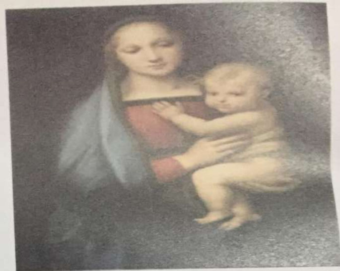
Rafael Santi • Madona • ulje na drvetu, 1504 god. Jedan od najvećih kolorista visoke renesanse

Čuveni renesansni majstori razradili su i čitavu teoretsku literaturu - npr. čuveni Traktat o slikarstvu - gdje su do detalja razmatrana pitanja kako pristupiti kompleksnom zadatku stvaranja harmonične i estetski savršene slike zasnovane na posmatranju čovjeka i prirode. Tokom XV i XVI vijeka razvoj renesansnog slikarstva konceptima realističkih kreacija uvodi evropsku likovnu kulturu u humanizirani ambijent, čemu se nije mogla oduprijeti ni moćna crkvena organizacija.