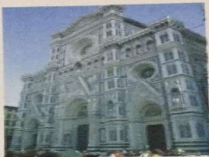
Glavna fasada firentinske katedrale