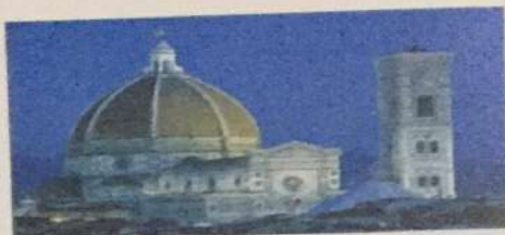
Santa Maria del Fiore • Firenca, XIV - XV v.