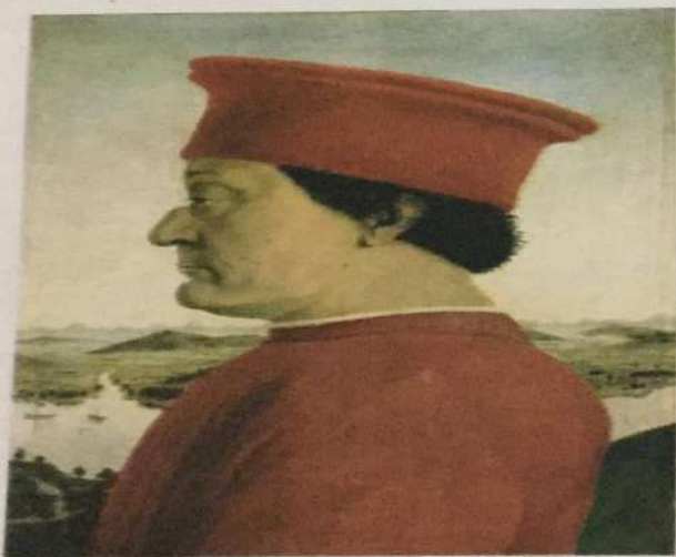
Pjero dela Frančesko • Portret grofa od Urbina • tempera na drvetu, 1465 - 66. god. Izvanredan Frančeskin portret prikazuje urbinskog plemića izbjegnuto je idealizovanje lika. Slika je jasno razvijena u tri perspektivna plana što stvara izvanrednu iluziju prostora