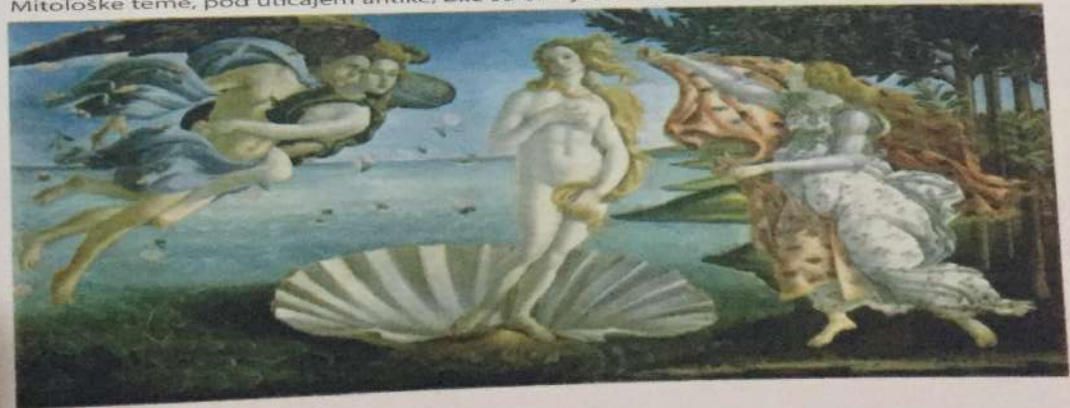
Sandro Botičelli • Rađanje Venere • ulje na platnu, 1478. god. Mitološke teme, pod uticajem antike, bile su omiljene u doba renesanse

Arhitekturu, kao dominantnu umjetničku granu srednjeg vijeka kojoj su bile podređene sve ostale likovne aktivnosti, u doba renesanse zamjenjuje slikarstvo. Orijentisani u početku na tehnike »al seco« i tempere, renesansni slikari sve više usvajaju metod izvedbe pomoću ulja na platnu ili dasci što im omogućava širok spektar »beskonačnih« intervencija u cilju postizanja efekta što realnije iluzije figure i prostora. Već prva generacija velikih italijanskih slikara okrenuta novim shvatanjima - Đjoto, Dučo, Martini, braća Lorenzeti... teži ka razmatranju volumena, realnoj anatomiji ljudskog tijela, rezvijenoj kompoziciji u okviru zanimljivih perspektivnih rješenja.