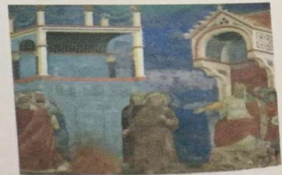
Di Bondone Đoto • Sv. Franjo ispred sultana • crkva Sv. Franje, Asizi, poslije 1288. god. U Đotovom slikarstvu uvode se perspektivni sistemi čime se nagovještava prelaz od srednjovjekovne ka novoj renesansnoj koncepciji likovnosti

Osnova i suština likovne umjetnosti renesanse, obnova antičkih kreativnih modela, ni u kom slučaju neće značiti postupak pukog podražavanja djela čuvenih grčkih i