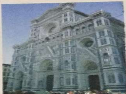
Glavna fasada firentinske katedrale