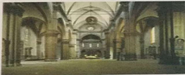
Enterijer crkve Santa Maria del Fiore, XIV - XV v.