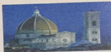
Santa Maria del Fiore • Firenca, XIV - XV v.