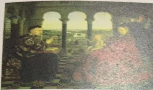
Van Ajk • Bogorodica kancelara Rolana, ulje na drvetu Najveći holandski renesansni majstor