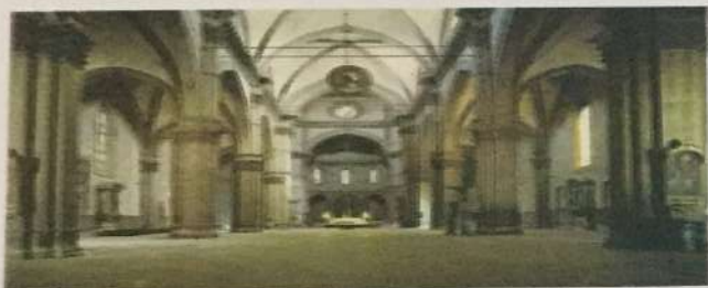
Enterijer crkve Santa Maria del Fiore, XIV - XV v.