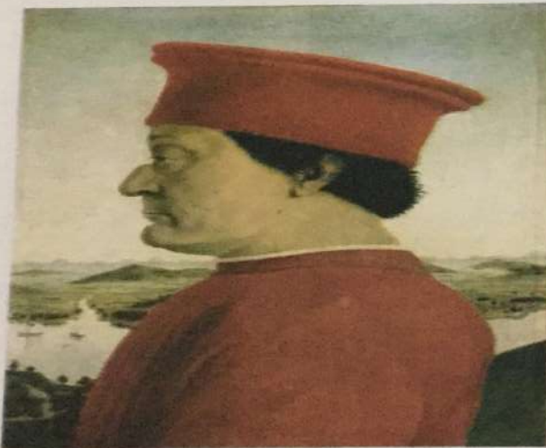
Pjero dela Frančesko • Portret grofa od Urbina • tempera na drvetu, 1465 - 66. god. Izvanredan Frančeskin portret prikazuje urbinskog plemića izbjegnuto je idealizovanje lika. Slika je jasno razvijena u tri perspektivna plana što stvara izvanrednu iluziju prostora