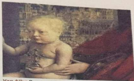
Van Ajk • Bogorodica kancelara Rolana • Detalj